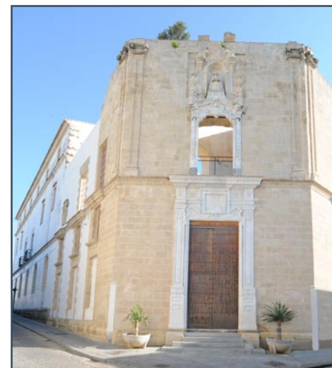
Sede Hospitalito del Museo Municipal (esquina a calles Ganado y Zarza)