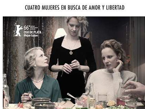
CUATRO MUJERES EN BUSCA DE AMOR Y LIBERTAD