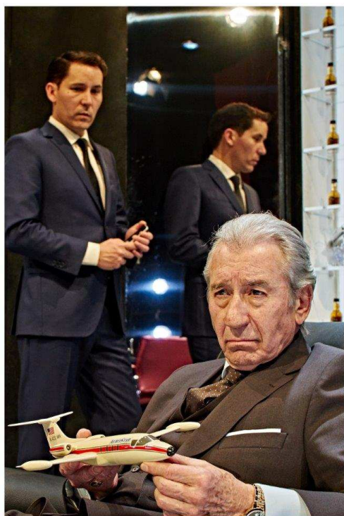
DIRECTOR: JUAN CARLOS RUBIO