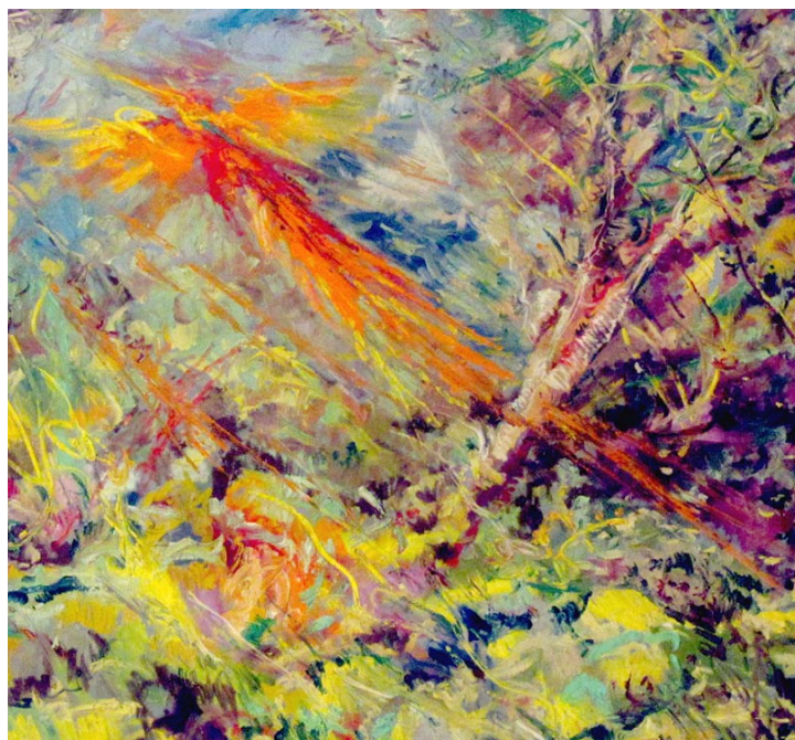
Enrique Ochoa. "El pájaro de fuego" de Stravinsky